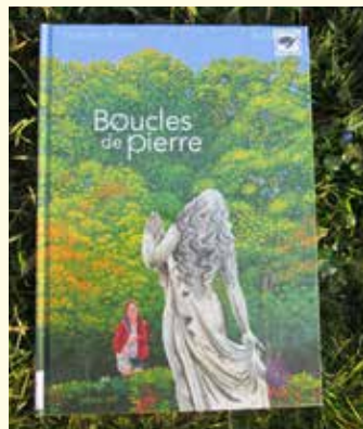
Boucles de pierre

Et si l'avenir du village était en jeu? Et si tout était lié à la Phrase sans fin, cette mystérieuse phrase laissée en suspens par l'Auteur?