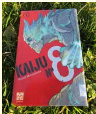
Kaiju N°8, Tome 1 Naoya Matsumoto (Manga)