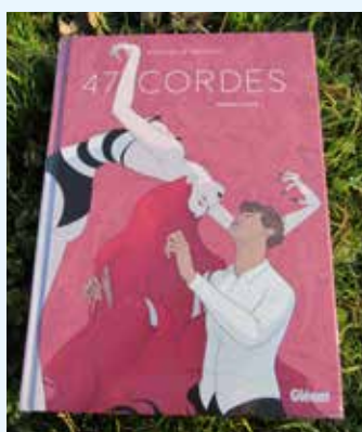
47 cordes, tome 1 Timothé Le Boucher (Bandes dessinées)

Tu t'appelles Louise Lefebvre et tu es la nouvelle nurse d'une famille américaine. Après t'avoir présenté leurs enfants Tom et Cissy, le couple t'annonce que tu devras les accompagner aux États-Unis. En cette année 1912, tu t'apprêtes alors à embarquer sur le plus grand paquebot du monde: l'insubmersible Titanic. Pour toi qui n'as jamais voyagé mais qui en as tant rêvé, l'heure est venue de quitter Calais, ta ville natale. Une menace plane cependant sur cette traversée de l'Atlantique qui te réserve bien des surprises... Lorsque le moment sera venu, feras-tu les bons choix?