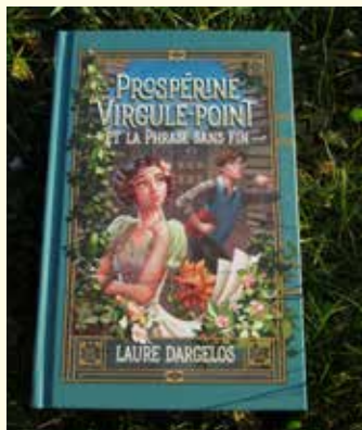
Prospérine Virgule-Point et la phrase sans fin Laure Dargelos (Roman)

Demi-Mot aurait pu être un village ordinaire, s'il n'était pas bâti à la limite du Texte. Jour après jour, les habitants polissent et astiquent les lettres; ils entretiennent ces milliers de caractères qui, sans leur concours, se seraient déjà effondrés. Chez les Virgule-Point, l'ainée de la fratrie a choisi une voie bien différente: fleuriste! Elle préfère bichonner des Trompettes à pétales plutôt que de faire prospérer l'empire des points et des virgules. Mais un événement inexplicable ne tarde pas à l'entraîner dans une spirale qui la dépasse?