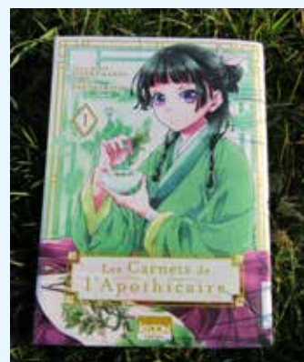
Les carnets de l'apothicaire, tome 1 Natsu Hyuuga (Manga)

Elif Shafak crée des personnages débordant d'humanité mais aussi de failles et de doutes, d'élan de générosité et de contradictions, pour conter l'histoire d'un amour interdit dans un climat de haine et de violence qui balaie tout sur son passage.