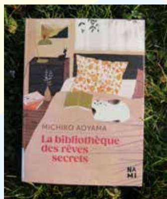
La bibliothèque des rêves secrets Michiko Aoyama (Roman)

Un jour, une métamorphe tombe amoureuse d'un jeune homme nommé Ambroise. Elle peut changer de forme à volonté, mais des questions finissent par la hanter: quel visage doit-elle incarner pour se faire aimer? Qui doit-elle être pour conquérir sa proie?