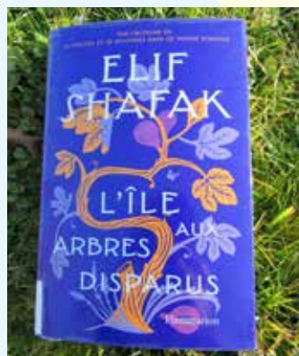
L'île aux arbres disparus Elif Shafak (Roman)